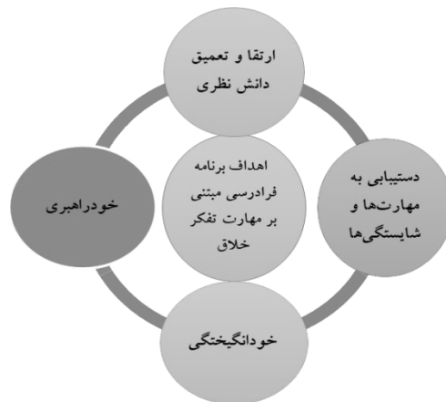
شکل ۲: اهداف برنامه فرادرسی به منظور تقویت مهارت تفکر خلاق