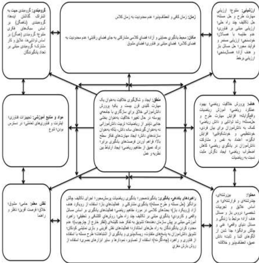
شکل ۲: الگوی برنامه درسی مبتنی بر تفکر خلاق در درس ریاضی پایه ششم ابتدایی

طبق منطبق برنامه درسی مبتنی بر تفکر خلاق در درس ریاضی پایه ششم ابتدایی، دلایل به کارگیری این برنامه درسی، ایجاد و شکل‌گیری خلاقیت به‌عنوان مهارت کلیدی قرن بیست و یکم، تربیت دانش‌آموزان خلاق و سازندگان دانش، ایجاد مهارت‌های تفکر سطح بالا، فراهم آوردن فرصت‌های یادگیری برابر و ایجاد ارتباط بین نظریه و عمل است. بر این اساس اهداف برنامه درسی پرورش خلاقیت ریاضی از طریق آموزش ریاضیات واقع‌گرایانه، بهبود عملکرد و پیشرفت تحصیلی، افزایش مهارت حل مسئله و توانایی ریاضی، تقویت خودتنظیمی و خودتکویفی دانش‌آموزان، افزایش انگیزه، اعتماد به نفس و مشارکت در یادگیری ریاضی،