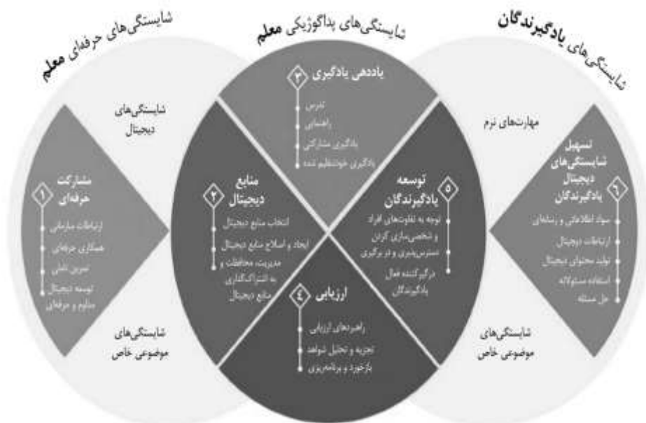
شکل ۱. مؤلفه‌های مرتبط با ۶ بخش و ۳ گروه در الگوی شایستگی‌های معلمان (DigCompEdu)

این ۳ گروه کلی شامل شایستگی‌های حرفه‌ای معلم، شایستگی‌های یادگیرندگان و شایستگی‌های یادگیرندگان است که بخش‌های اصلی شش‌گانه شایستگی‌ها و مؤلفه‌های مرتبط با آن‌ها را در بر گرفته‌اند. بخش اول، با عنوان «مشارکت حرفه‌ای»، ذیل شایستگی‌های حرفه‌ای معلم قرار دارد و شامل ۴ مؤلفه؛ ارتباطات سازمانی، همکاری حرفه‌ای، فعالیت تأملی و توسعه دیجیتال مداوم و حرفه‌ای است. هسته اصلی در این چهارچوب بخش‌های ۲ تا ۵ است که همراه با یکدیگر گروه شایستگی‌های یادگیرندگان، یعنی شایستگی‌های دیجیتالی را که معلمان برای تدریس خلاقانه، کارآمد و مؤثر به آن‌ها نیاز دارند، تشکیل می‌دهند. بخش دوم مربوط به «منابع دیجیتال» می‌شود که حاوی سه مؤلفه؛ انتخاب منابع دیجیتال، ایجاد و اصلاح منابع دیجیتال و مدیریت، محافظت و به‌اشتراک‌گذاری منابع دیجیتال است. بخش سوم «یاددهی - یادگیری» است که شایستگی اساسی در کل چهارچوب، یعنی شایستگی تدریس در آن قرار دارد. چهار مؤلفه این بخش؛ تدریس، راهنمایی، یادگیری مشارکتی و یادگیری خودتنظیم‌شده است. بخش چهارم یعنی «ارزیابی»، دارای سه مؤلفه راهبردهای ارزیابی، تجزیه