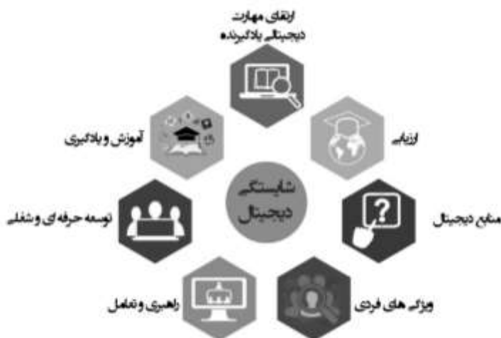
شکل ۲: طرح شماتیک ابعاد شایستگی دیجیتال معلمان بر اساس مرور نظام‌مند مطالعات

پس از استخراج کدها و مشخص نمودن ابعاد و مؤلفه‌ها، طرح شماتیک یافته‌ها طراحی گردید که در شکل ۲ ارائه شده است.