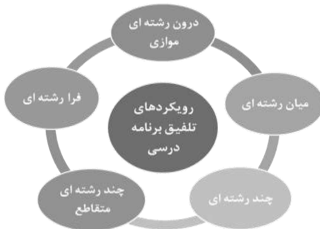
شکل ۱. انواع رویکردهای تلفیق (ماس و همکاران، ۲۰۱۹)

نیازهای آموزشی فزاینده در قرن بیست و یکم پذیرای آموزش‌های سنتی در قالب نظام‌های درسی مستقل و مجزا نیست (دریک ۱ و رید ۲ ، ۲۰۱۸). چراکه در زمینه فعال کردن دانش‌آموزان در فرایند یادگیری و ایجاد انگیزه و علاقه در آنان ناکام مانده است (احمدی و همکاران، ۱۴۰۰). از این رو، ضرورت طراحی و سازماندهی برنامه‌های درسی تلفیقی به منظور تزریق ویژگی چابکی، چالاکی و پویایی در برنامه‌های درسی مدرسه‌ای (مهرمحمدی، ۱۳۹۱)، دستیابی دانش‌آموزان به وحدت و یکپارچگی در تجربیات یادگیری و پیشرفت مطلوب در ابعاد شناختی و زمینه‌های اجتماعی و عاطفی آشکار می‌شود (رستمی مسنی، ۱۳۹۳). برنامه درسی تلفیقی ضمن مطرود کردن رویکردهای سنتی با موضوعات و مفاهیم آموزشی منفصل و تصنعی در پی ایجاد ارتباط و پیوند میان حوزه‌های موضوعی است و با اتخاذ یک نگرش کل‌گرایانه در پی مرتبط ساختن آموزش با زندگی روزمره (مولا و همکاران، ۱۳۹۷) و معنادار کردن (مذبوحی، ۱۳۹۶) و تعمیق یادگیری (دریک و رید، ۲۰۱۸) است. هدف اصلی این برنامه‌درسی یکپارچه، توجه بر رویکرد دانش‌آموز محور است تا با درگیرکردن دانش‌آموزان در پروژه‌ها و مطالعات فردی و گروهی کوچک در کلاس درس، یادگیری را بهبود و علاقه را افزایش دهد (بیسکو ۳ و ویلسون ۴ ، ۲۰۱۵).