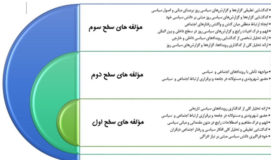
نمودار شماره ۲: سطوح تحلیلی و وزندهی مؤلفه‌های سواد سیاسی

در نگاه دیگر می‌توان این پنج مؤلفه را به عنوان زیربنا و هسته اصلی مباحث مطرح در طراحی برنامه درسی در نظر گرفت و دو مؤلفه «حضور شهروندی و مسئولانه در جامعه و و برقراری ارتباط اجتماعی و سیاسی» و «مواجهه تأملی با رویدادهای اجتماعی و سیاسی» را در مرحله بعدی متناسب با مراحل رشدی متوسطه اول و شش مؤلفه «فهم و درک ادبیات رایج و گزارش‌های سیاسی روز در سطح داخلی و بین‌المللی»، «کدگشایی تطبیقی گزاره‌ها و گزارش‌های سیاسی روز بر مبنای مبانی و اصول سیاسی»، «کدگشایی گزاره‌ها و گزارش‌های سیاسی روز مبتنی بر دانش سیاسی خود»، «ارائه تحلیل کلی از کدگذاری رویدادها، گزاره‌ها و گزارش‌های سیاسی روز»، «ارائه تحلیل شخصی از کدگشایی رویدادهای سیاسی داخلی و خارجی» و «ایجاد ارتباط منطقی میان کنش و واکنش رفتارهای اجتماعی» از سطح سوم را که به نوعی با درون‌مایه مشابه و ادبیات متفاوت و مفهومی بسیط‌تر با مؤلفه‌های دو سطح اول و دوم ارتباط دارند، در فرآیند طراحی برنامه درسی در سطح ثانویه و پیرامونی نسبت به مفاهیم محوری برنامه مورد توجه و تأکید قرار خواهد گرفت. نمودار شماره ۲ به این سطوح می‌پردازد.