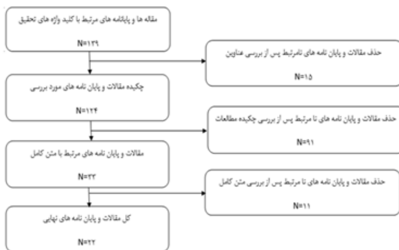
شکل ۱: نمودار مراحل ورود و خروج داده‌های اولیه

بر اساس ملاک‌های خروج و پس از بررسی‌های مختلف تعداد ۱۱۷ مطالعه که مناسب با اهداف این پژوهش نبودند از جریان فراتحلیل حذف و ۲۲ مطالعه برای تحلیل نهایی انتخاب شد. لازم به ذکر است که در بعضی از پژوهش‌ها دو یا چند متغیر مستقل و یا تعدیل‌کننده وارد شده بود که از این رو کلیه اطلاعات این دسته از پژوهش‌ها نیز اعمال شد. روند ورود و خروج مقالات و پژوهش‌ها در شکل زیر قابل مشاهده است: