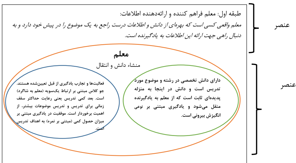
شکل ۲: عناصر دوگانه تجربه معلمان از تعاملات آموزشی

۲۰۰۰) بررسی شدند. با بررسی و مقایسه این کدها و موضوعات آن‌ها با هم و نهایتاً تشخیص تفاوت‌ها و شباهت‌ها، طبقات توصیفی (یا همان زمینه‌های اصلی ۱ ) شکل گرفت. پس از حصول طبقات اولیه، این سؤال مطرح شد که آیا طبقات استخراج شده توان توصیف‌کنندگی و دلالت کافی بر داده‌ها را دارند یا خیر؟ این فرایند اصلاح و بازنگری تا جایی ادامه داشت که طبقات اصلاح شده با داده‌های مصاحبه‌ها سازگار شدند. مرحله بعد ارائه مفاهیم حاصل شده در قالب طبقات توصیفی بود که دارای ساختار کامل یک مفهوم (عنصر ارجاعی، عنصر ساختاری، افق بیرونی، افق درونی ۲ ) است. نمونه‌ای از این مورد را در شکل ۲ ملاحظه می‌کنید.