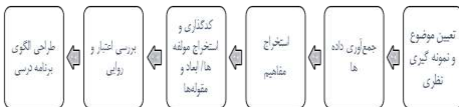
نمودار ۱. نمودار مراحل پژوهش

اطلاعات با استفاده از کدگذاری باز، محوری و گزینشی با استفاده از «الگوی کدگذاری» ۲ استروس و کوربین ۳ (۱۳۹۸) تحلیل شدند. در مرحله ابتدایی با بررسی مصاحبه‌های صورت گرفته در حوزه سواد مالی، نکات کلیدی، بیانات مهم و کدهای اولیه حاصل از مصاحبه نیمه ساختاریافته مورد استخراج قرار گرفت. سپس کدهای اولیه در چارچوب مفاهیم اولیه و در قالب ساختار مشخص دسته بندی شدند. مفاهیم به دست آمده در مرحله کدگذاری باز اولیه به منظور تشکیل مقوله‌های عمده در کدگذاری محوری (یا متمرکز)، مورد تحلیل مجدد قرار گرفت. سپس این مقوله‌ها در بخش‌های مختلف شامل اهداف، مفاهیم و غیره تقسیم‌بندی و الگوی تبیینی طراحی برنامه درسی سواد مالی ارائه شد (نمودار ۱).