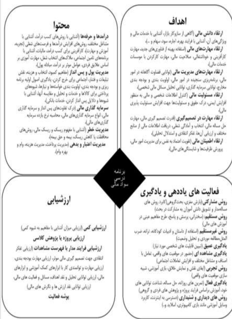
شکل ۲. الگوی برنامه درسی سواد مالی دوره ابتدایی بر اساس نظریه تایلر