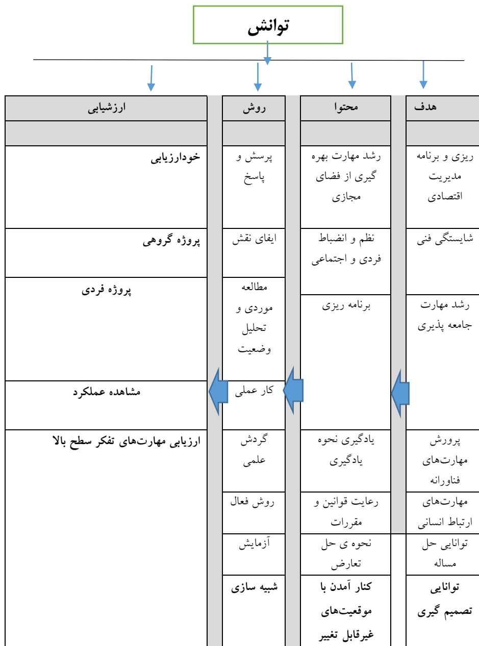
شکل ۳: الگوی مولفه‌های مرتبط به توانش