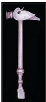
چکش فولادی با نقش پرنده از جنس فولاد

از سوی دیگر، در تصاویر مختلف استفاده شده می‌توان به نکاتی برخورد که نشان از رویکرد کتاب فرهنگ و هنر به مؤلفه‌ی توجه به تفاوت‌های هنرهای قومی دارد. تعدادی از این موارد در اینجا نشان داده شده است: