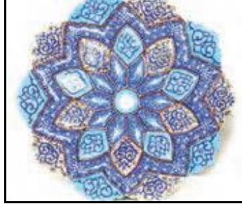
بشقاب میناکاری - اصفهان (فرهنگ و هنر پایه هفتم، ۱۳۹۶: ۵) قلاب‌دوزی - رشت (فرهنگ و هنر پایه هفتم، ۱۳۹۶: ۷)