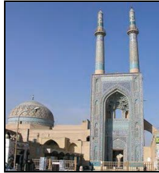
مسجد جامع یزد (فرهنگ و هنر پایه هشتم، ۱۳۹۶: ۲۶) مقبره شیخ صفی‌الدین اردبیل (فرهنگ و هنر پایه هشتم، ۱۳۹۶: ۲۷)

نتیجه تحلیل داده‌ها بر اساس فراوانی مشاهده شده در هر کدام از کتابهای هفتم، هشتم و نهم به تفکیک در جداول ۴، ۵ و ۶ آورده شده است.