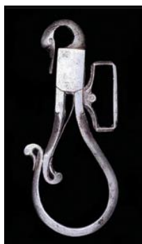
آویز کمر با نقش پرنده