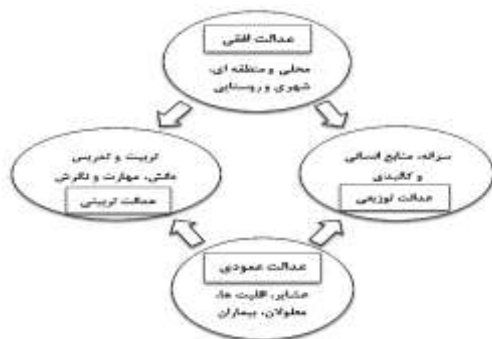
شکل ۱: انواع عدالت آموزشی و روابط آنها

و روستایی به نسبت جمعیت است و اما عدالت عمودی، به تفاوت‌های میان افراد مربوط می‌شود. بنابراین تساوی آموزشی به معنای آن نیست که همگان به سطح واحدی از تحصیلات ارتقا یابند؛ زیرا چنین امری به دلیل تفاوت استعدادها، افراد، غیرممکن است. پس معنای تساوی فرصت‌های آموزشی آن است که هیچ‌کس به تناسب هوش و استعدادها و علاقه‌مندی خود، به سبب فقدان امکانات و سایر شرایط غیرفردی، از دست‌یابی به تعلیم و تربیت محروم نماند (پیزا ۱ ، ۲۰۰۳؛ به نقل از سامری، ۱۳۹۳).